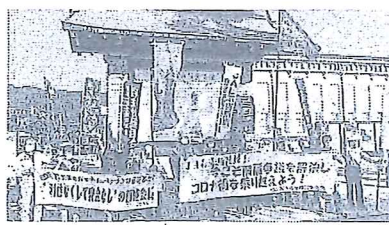
稲盛氏縁りの京セラ美術館前で

(下記、毎日新聞20年5月26日) 待ちわびた改築お披露目 京都市京セラ美術館 リニューアルオープンした。3月の開 館が、新型コロナウイルスの感染を踏まえてきた 遅れの披露目となった。 この足前時に開館すると、訪れ客 を減らした。開館の1時間前には、 だいたい開館前夜の会社員、職員等が 集まり、新型コロナウイルスの感染を 防止するため、当日はマスクの着用が 義務づけられたと報じた。 京都市の在籍に限り、1日の所要 00人までにとり、初日は2つの開館を 延べ600人の来場客は、開館を