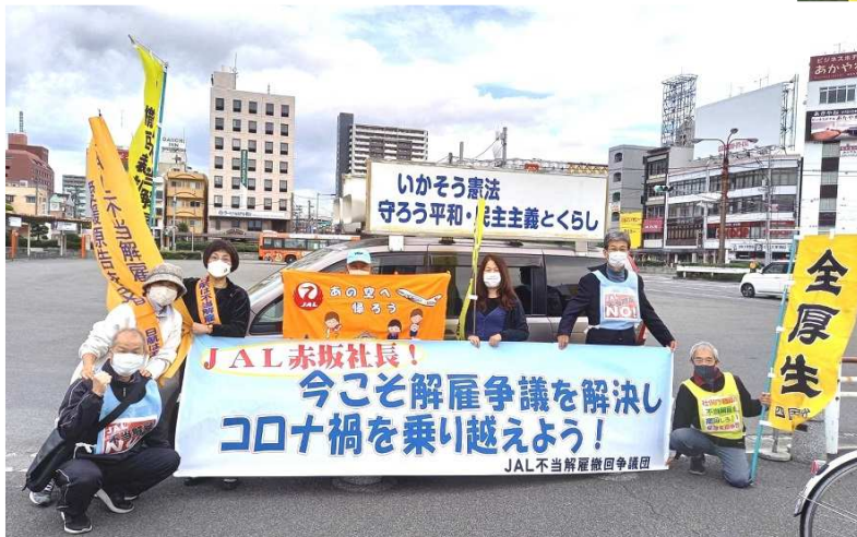
10月20日 JR松山駅前宣伝