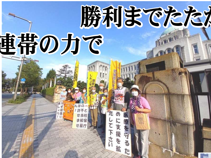
9月22日 快晴のもとでの県庁前宣伝