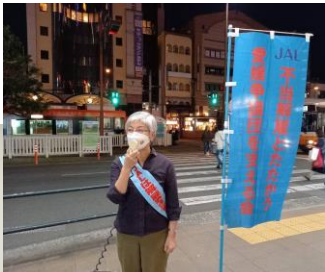
2023. 10. 27市駅前宣伝 支援の国鉄四国トレインズと争議団