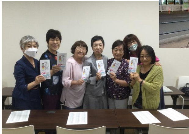
2023. 9. 28ミモザの会-愛媛県庁記者クラブ (女性差別撤廃条約選択議定書要請採択)