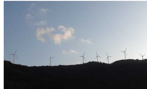
(二宮さん撮影の瀬戸の風車)

こういうことがなければ行くことのなかった裁判所、座ることのなかった法廷、知り合ったたくさんの方々、裁判や法律のこのみならず政治経済まで、社会で今何が起きているか、いままでに何が起きているのか、たくさん勉強させていただきました。いい経験をしていると思いません。不安定な原告という