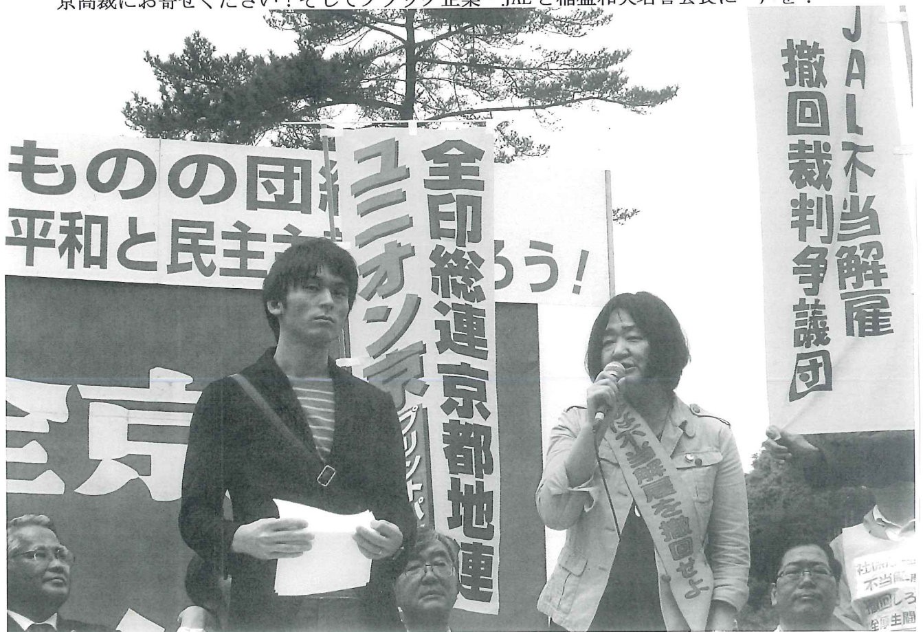
8千人の参加者に訴える JAL 原告団（右）、プリントパックの仲間（二条城前広場）

不法・違法な労働者使い捨てのブラック企業が社会問題となっています。労働者が人間らしいくらしができるため、その闘いの先頭でこの3年半、JAL 不当解雇撤回原告団は闘い抜いてきました。稲盛和夫会長（解雇当時）が「経営上、解雇の必要がなかった」と証言したとおり、不当解雇です。東京地裁では思わぬ不当判決でしたが、東京高裁判決（6/3・CA、6/5・パイロット）が近づいています。”公正判決を！”の声を、東京高裁にお寄せください！そしてブラック企業・JAL と稲盛和夫名誉会長に一声を！