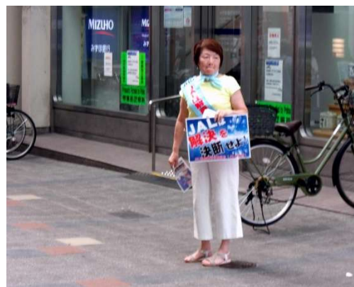
伏見・大手筋宣伝行動 2025. 7. 29